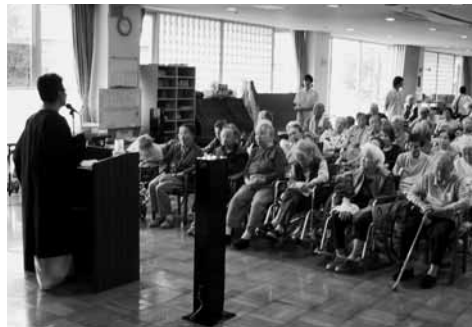
ビーハラ法話会－メデイトピアこがー

「アマダさまのお救いを『観無 量寿経』には「撰取不捨」とい い、それを親鸞聖人は「にぐる ものをおわえとるなり」と味わつ ておられます。何かの事情で心 を閉ざし、人に背を向けてしまつ た人の心を開くのは、どんなこ とがあつてもあなたを一人には