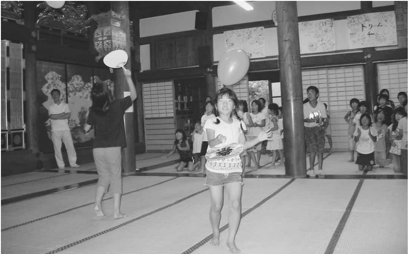
「子ども会風景」(大海組・長光寺)