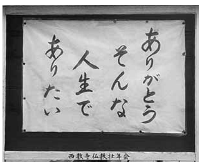
津久見 西教寺掲示板

ふとしたことばの出会いが、人生の喜び又悩みから開放され、生きることの意味を見つけ出すご縁になればと、平成十三年より、仏壮の方がご院家さんと相談の上、心に響いたことばを書き、旧津久見市内十ヶ所に掲示されています。以来十三年続けられています。山門横の掲示は学生がよく目にしていると。会員数減少傾向にあるのが悩みだが、これからも続けて行きたいと言われました。