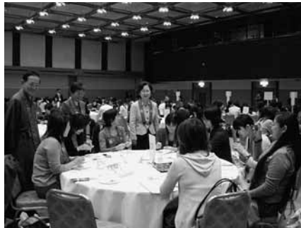
班別ワークショップ