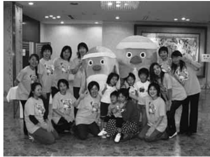
「メジロン」といっしょ…

☆オリエンテーリングを皆で取り 組んでいくことで、初対面同士 すんなり打ち解けていき、その 後の座談会でも発言しやすくな った。