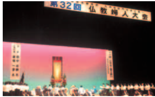
開 会 式

カメラに向かって『ニコッ』。ちよつとピントがずれてしまいました。が、佐賀に来て良かったと思えました。田中先生のご法話は問題提起とまとめがあり、トークライブも心温かくなるものでした。少し外れたところは、まとめて田中先生がきちんと押さえて下さいました。佐賀の仏婦の方の準備等には感謝・感謝です。