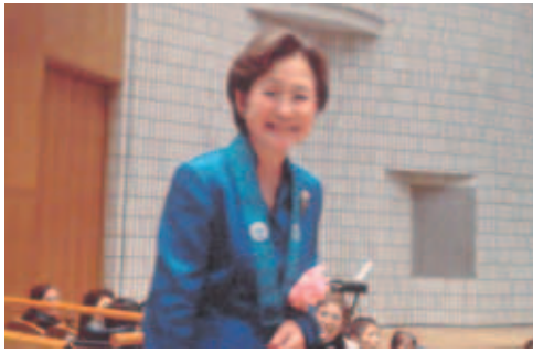
総 裁 様

十一月七日、絆・いのち・寄り添い〜ひとりじゃなかもんくのテーマのもと、佐賀文化会館で開催されました。大分教区より一五〇名の参加があり、今までと違い全体でも千八百名という少ない大会でしたが、それだけ近くで開会の式も見ることが出来ると思いでいました。その時です！総裁様が入場され、私の前を通られるのです。慌ててカメラを構えたところ、な、なんと!